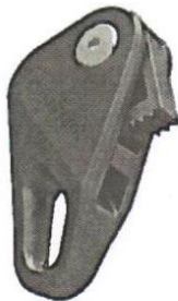
Lanový zámek s plastovou západkou