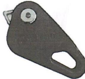
Lanový zámek s kovovou západkou

Společnost Redcord doporučuje všem zákazníkům, kteří zakoupili přístroj Redcord Axis, aby okamžitě přestali používat lanový zámek dodávaný se zařízením Redcord Axis.